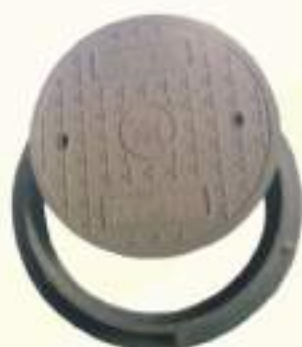
Φ500 Φ600 耐荷重5-15噸